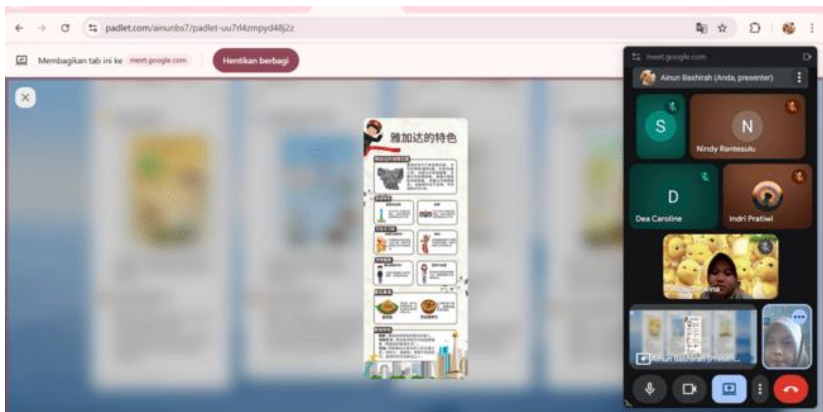
Gambar 2. Sesi Presentasi Poster Secara Kelompok