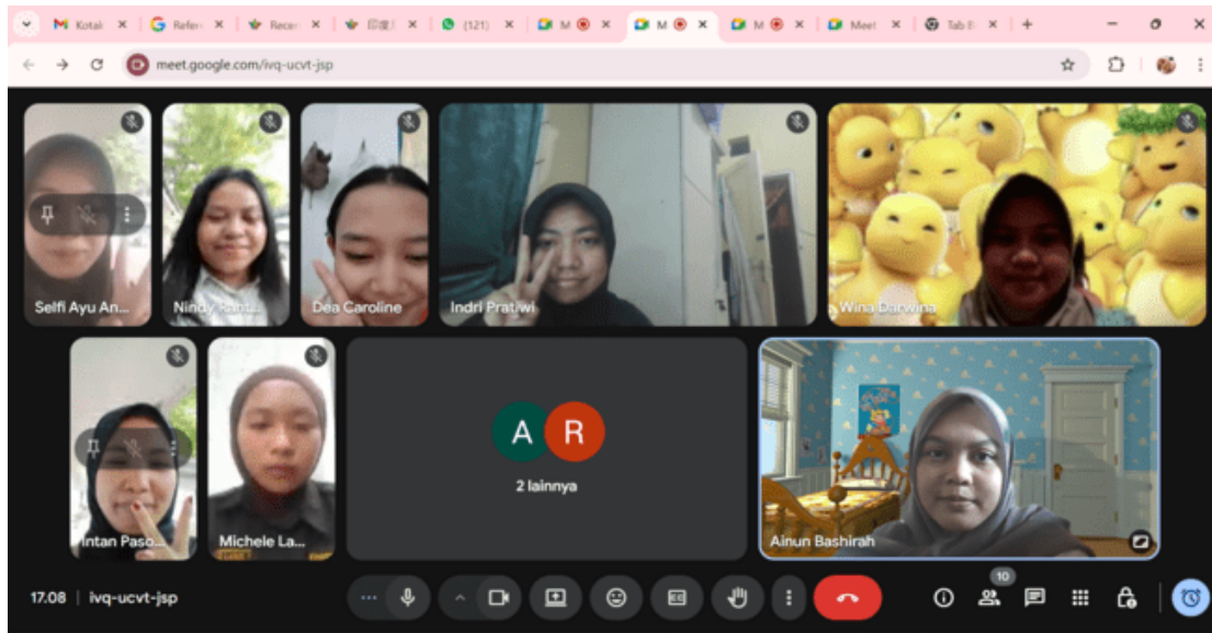
Gambar 3. Sesi Dokumentasi Pelatihan