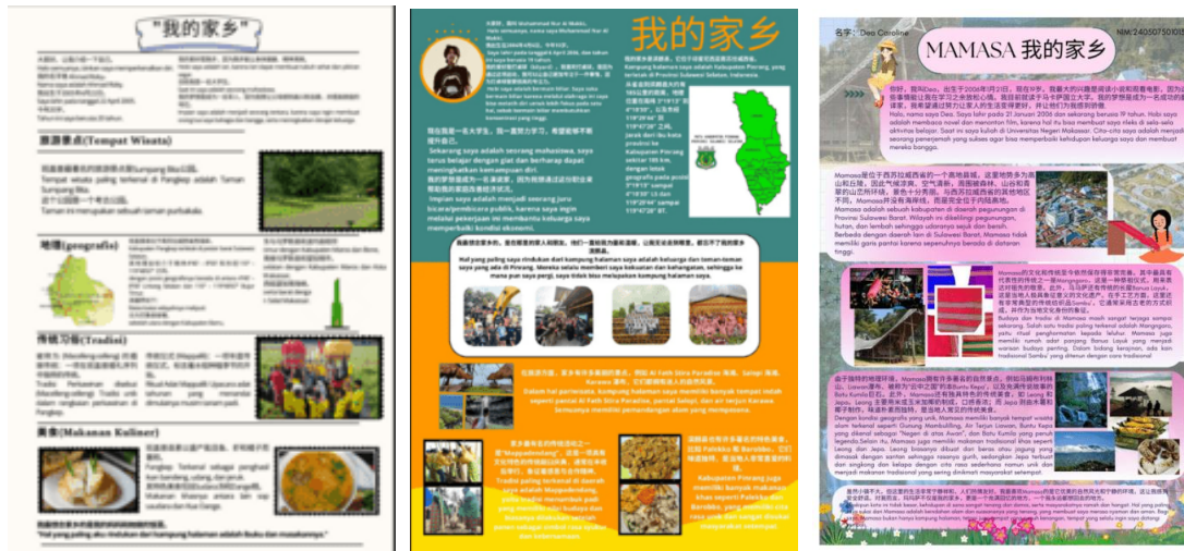
Gambar 1. Hasil Desain Poster Tema Kampung Halamanku Menggunakan Aplikasi Canva