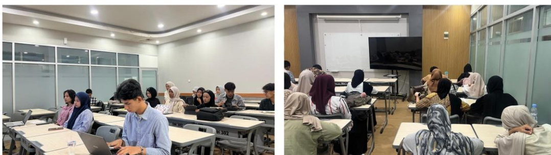
Gambar 3. Dokumentasi praktik individual, diskusi kelompok kecil, dan refleksi kelas