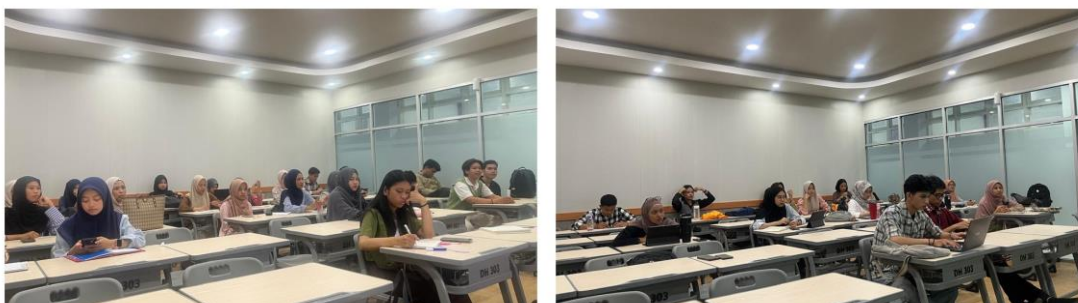
Gambar 2. Dokumentasi orientasi awal, pemetaan pengalaman peserta, dan praktik analisis audio-visual

Dokumentasi berikut memperlihatkan suasana pelaksanaan kegiatan, mulai dari orientasi, praktik analisis, pendampingan individu, hingga refleksi kelas. Setiap foto diberi keterangan agar dokumentasi tidak hanya menjadi pelengkap visual, tetapi juga menunjukkan tahapan pengabdian yang berlangsung.