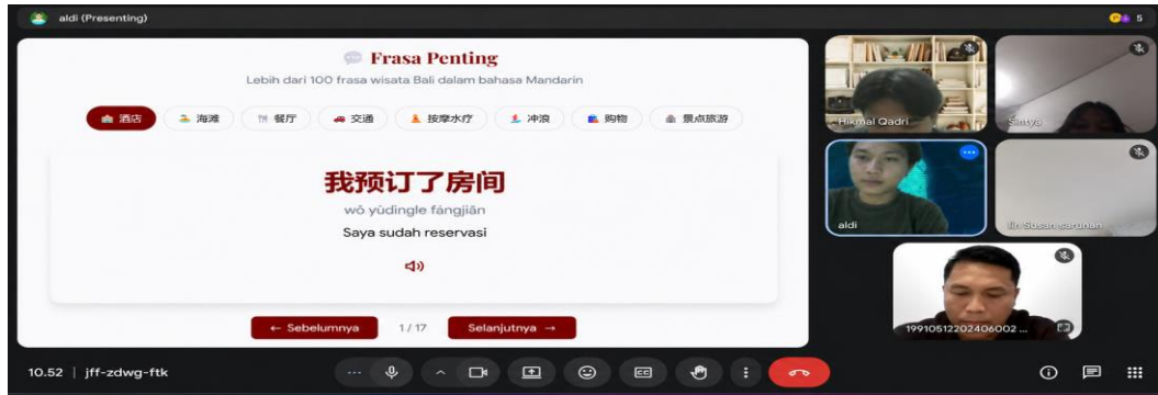
Gambar 2. Pengembangan konten website

destinasi wisata, video singkat, hyperlink, dan beberapa fitur visual pendukung lainnya untuk meningkatkan daya tarik website.