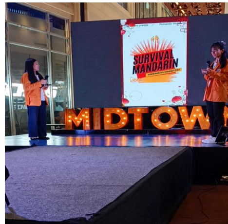
Gambar 3 & 4. Presentasi Proyek di Trans Studio Mall