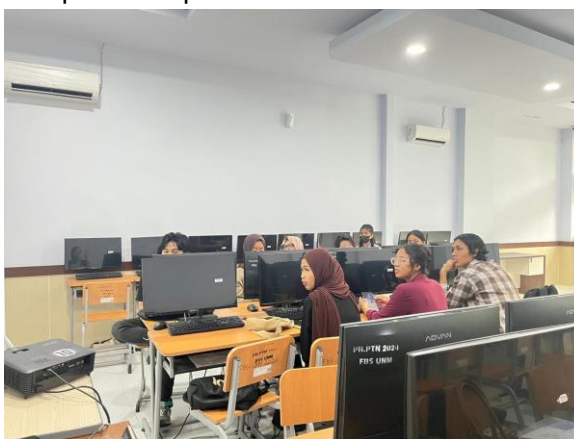
Gambar 2. Pengenalan aplikasi CapCut kepada peserta

Pemateri menyampaikan materi pengenalan aplikasi CapCut secara komprehensif, meliputi sejarah singkat aplikasi, keunggulan aplikasi dibandingkan dengan aplikasi editing lain serta fitur-fitur utama yang akan digunakan dalam workshop. Presentasi dilengkapi dengan slide Powerpoint untuk memudahkan pemahaman peserta.