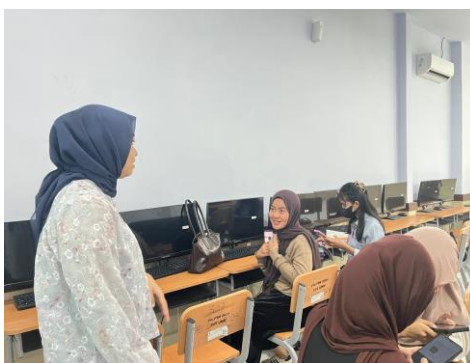
Gambar 1. Pembukaan kegiatan workshop oleh pemateri

Kegiatan dimulai dengan sesi pembukaan yang mencakup sambutan dari tim pelaksana sekaligus berperan sebagai pemateri, penjelasan tujuan kegiatan serta alur kegiatan workshop secara keseluruhan. Pada tahapan ini, peserta juga diberikan gambaran umum mengenai pentingnya keterampilan editing video dalam konteks pembelajaran khususnya bahasa Mandarin serta kaitannya dengan dunia kerja pada bidang perhotelan.