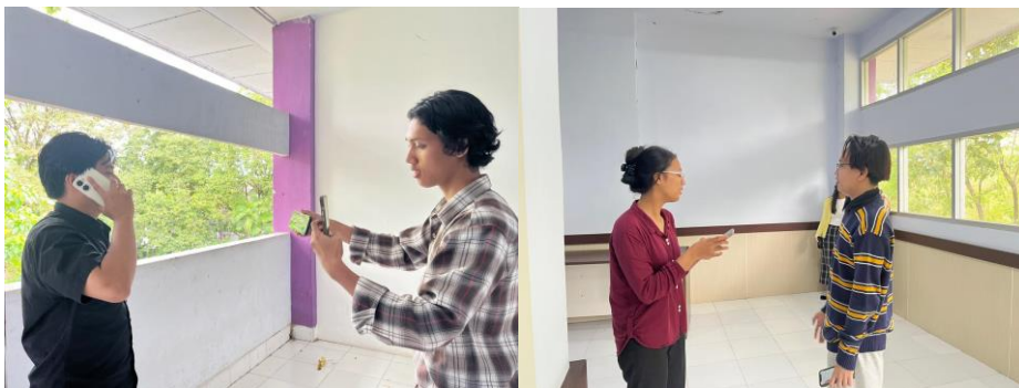
Gambar 4. Kegiatan praktik pengambilan video oleh peserta

Peserta kemudian dibagi menjadi beberapa kelompok kecil. Setiap kelompok membuat video dengan tema percakapan yang berbeda dalam konteks industri perhotelan, seperti memesan hotel, komplain fasilitas hotel yang bermasalah, pemesanan kamar dan informasi fasilitas hotel. Kelompok kemudian merancang skrip percakapan dan memproduksi video secara bersama-sama dengan melakukan pengeditan di aplikasi CapCut.