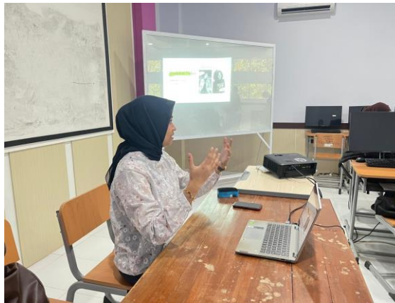
Gambar 3. Demonstrasi penggunaan fitur aplikasi CapCut

Pemateri melakukan demonstrasi secara langsung mengenai penggunaan berbagai fitur yang terdapat pada aplikasi Capcut, seperti menambahkan teks, gambar, suara, memotong klip video, serta mengaplikasikan filter dan transisi. Pemateri juga memperlihatkan berbagai video yang dapat menjadi sumber inspirasi dalam pengembangan video berbahasa Mandarin dan tata cara mengambil video dari berbagai sudut. Para peserta mengikuti setiap langkah demonstrasi secara langsung di perangkat masing-masing.