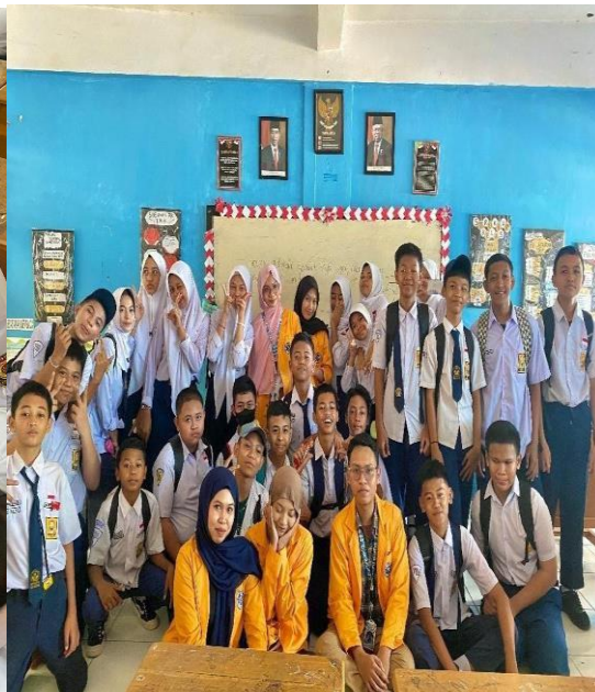
Gambar 6. Foto Bersama