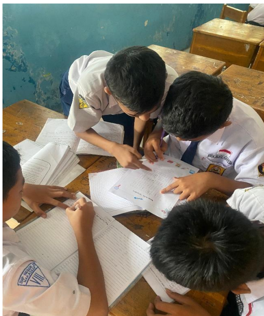
Gambar 5. Bermain Snakes Word

Foto bersama tim pelaksana, guru, dan siswa setelah kegiatan ditunjukkan pada Gambar 6.