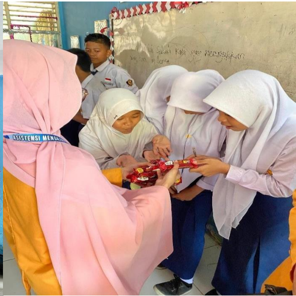
Gambar 4. Pemberian Punishment Edukatif