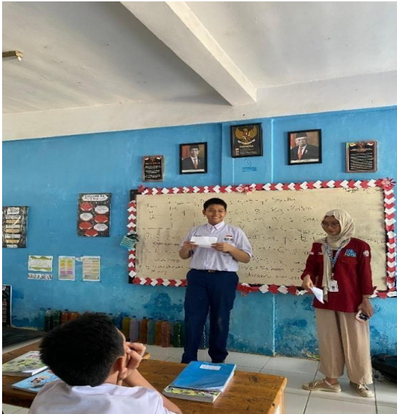
Gambar 3. Pemberian Reward