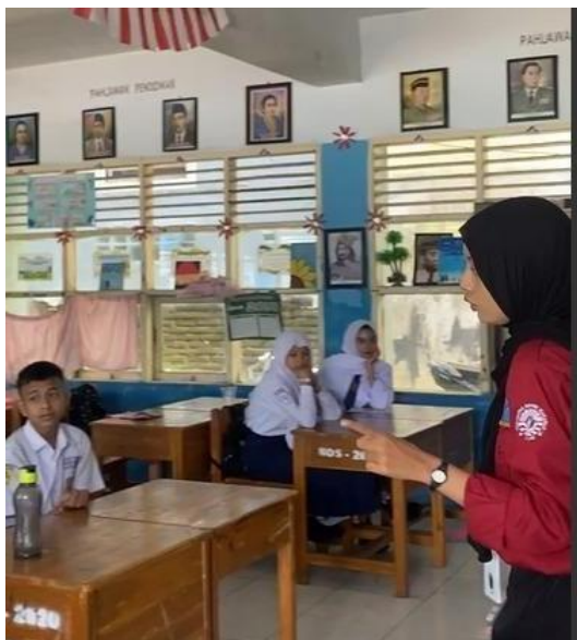
Gambar 1. Penjelasan Materi.

penggunaannya. Media permainan yang disiapkan meliputi lembar Scrambled Word untuk materi adjective dan lembar Snakes Word untuk materi noun. Reward disiapkan dalam bentuk cokelat sebagai apresiasi bagi kelompok yang aktif dan berhasil menyelesaikan permainan, sedangkan punishment edukatif diberikan dalam bentuk refleksi lisan bagi kelompok yang belum mencapai target permainan.