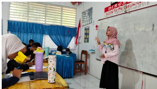
Gambar 3. Pelaksanaan Pertemuan Kedua pada Kelas Menulis