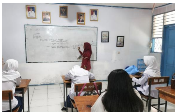
Gambar 4. Pelaksanaan Pertemuan Ketiga pada Kelas Menulis

Sebagai luaran pembelajaran, siswa diminta membuat pesan atau surat formal yang komunikatif. Mereka mempraktikkan cara menyusun surat izin tidak masuk sekolah atau pesan resmi kepada guru melalui platform digital, dengan memperhatikan struktur yang sopan, pilihan kata yang santun, serta penggunaan tanda baca yang benar agar informasi dapat tersampaikan dengan baik. Hasil kegiatan menunjukkan bahwa siswa mampu menghasilkan teks formal yang lebih rapi, jelas, dan sesuai dengan kaidah bahasa Indonesia, sehingga keterampilan menulis mereka semakin terasah.