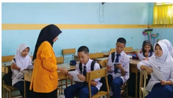
Gambar 5. Pelaksanaan Pertemuan Keempat pada Kelas Menulis

Sebagai produk final, siswa menyusun sebuah narasi pendek dengan penggunaan imbuhan yang benar dan sempurna. Narasi ini menjadi muara dari seluruh materi pertemuan sebelumnya, di mana mereka menggabungkan keterampilan menyusun ulang teks, ketepatan huruf kapital, dan pemahaman tanda baca ke dalam satu kesatuan cerita pendek yang utuh, komunikatif, dan sesuai kaidah bahasa Indonesia. Hasil akhir menunjukkan bahwa siswa mampu menghasilkan tulisan yang lebih rapi, jelas, dan bermakna, sekaligus menutup rangkaian pelatihan dengan capaian yang komprehensif.