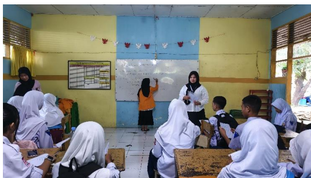
Gambar 2. Pelaksanaan Pertemuan Pertama pada Kelas Menulis

Pada akhir sesi, siswa berhasil menyusun kembali pesan-pesan yang semula sulit dipahami menjadi kalimat yang padu, lengkap, dan sesuai dengan aturan kebahasaan. Hasil ini menunjukkan bahwa pendekatan berbasis praktik langsung mampu meningkatkan keterampilan menulis sekaligus membangun kesadaran kritis terhadap pentingnya penggunaan bahasa formal. Pertemuan pertama ini menjadi langkah awal yang baik dalam memperbaiki kebiasaan menulis siswa dan mempersiapkan mereka untuk tahap pelatihan berikutnya.