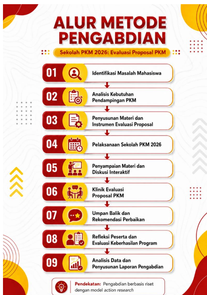
Gambar 1. Alur Metode Pengabdian

Tahap keempat adalah refleksi dan pengukuran keberhasilan program. Refleksi dilakukan untuk mengetahui sejauh mana kegiatan mampu meningkatkan pemahaman peserta terhadap penyusunan dan evaluasi proposal PKM. Pengukuran keberhasilan menggunakan model evaluasi sederhana berbasis reaction, learning, and product improvement yang diadaptasi dari evaluasi pelatihan Kirkpatrick dan Kirkpatrick (2016). Aspek reaction digunakan untuk melihat respons peserta terhadap kegiatan, aspek learning digunakan untuk melihat peningkatan pemahaman peserta, sedangkan aspek product improvement digunakan untuk melihat perubahan kualitas ide atau proposal setelah memperoleh pendampingan. Alur metode pengabdian dapat dilihat pada.