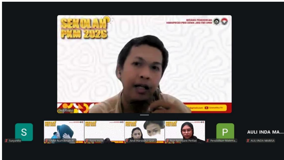
Gambar 2. Tahap Awal Penyampaian Materi

memiliki pengalaman dalam pembinaan mahasiswa dan pengembangan kegiatan akademik kemahasiswaan. Secara umum, kegiatan berjalan dalam tiga pola utama, yaitu penyampaian materi, diskusi interaktif, dan evaluasi terhadap gagasan atau rancangan proposal PKM mahasiswa.