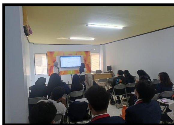
Gambar 1. Proses Pelatihan English for Meeting