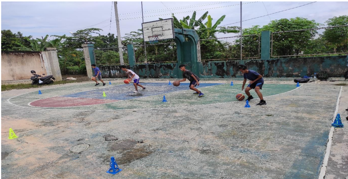
Gambar 3. Pelaksanaan Kegiatan

Hasil dari kegiatan coaching clinic ini adalah menunjukkan motivasi peserta untuk aktif kegiatan coaching clinic dari narasumber sangat baik. Penggunaan metode ceramah, demonstrasi, praktik, dan evaluasi terbukti membantu peserta dalam memahami gerakan teknik dasar bola basket. Selain itu, pendekatan coaching clinic yang menggabungkan teori dan praktik secara terpadu memberikan dampak positif bagi pemahaman peserta tentang taktik permainan. Peran instruktur yang kompeten dan berpengalaman juga menjadi faktor kunci keberhasilan kegiatan ini. Interaksi langsung antara instruktur dan peserta menciptakan iklim belajar yang kondusif dan memotivasi siswa untuk terus berlatih dengan sungguh-sungguh. Hal ini tercermin dari tingkat kehadiran yang tinggi dan antusiasme peserta sepanjang kegiatan berlangsung.