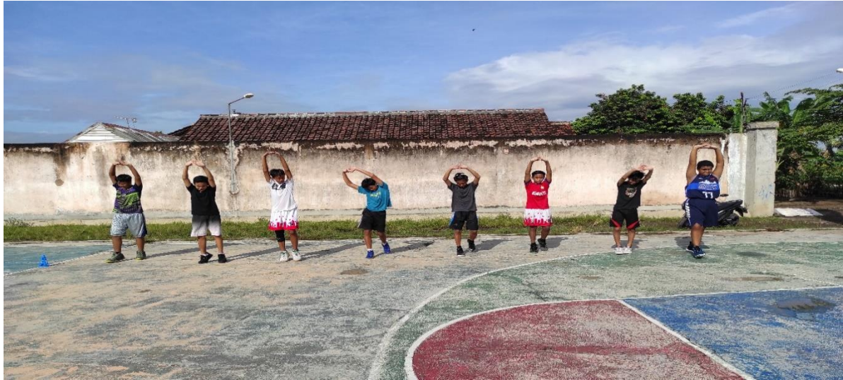
Gambar 2. Pelaksanaan Kegiatan

Hasil dari kegiatan coaching clinic ini adalah menunjukkan motivasi peserta untuk aktif kegiatan coaching clinic dari narasumber sangat baik. Penggunaan metode ceramah, demonstrasi, praktik, dan evaluasi terbukti membantu peserta dalam memahami gerakan teknik dasar bola basket. Selain itu, pendekatan coaching clinic yang menggabungkan teori dan praktik secara terpadu memberikan dampak positif bagi pemahaman peserta tentang taktik permainan. Peran instruktur yang kompeten dan berpengalaman juga menjadi faktor kunci keberhasilan kegiatan ini. Interaksi langsung antara instruktur dan peserta menciptakan iklim belajar yang kondusif dan memotivasi siswa untuk terus berlatih dengan sungguh-sungguh. Hal ini tercermin dari tingkat kehadiran yang tinggi dan antusiasme peserta sepanjang kegiatan berlangsung.